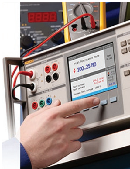
Obr. 1. Kalibrátor Fluke 5320

Použitím výsledků experiment a zkušeností a s předpokladem normálního rozdělení a nalezením standardní odchylky z významného počtu vzorků konstruktéři nastaví specifikace daného přístroje, které jsou poté použity při výrobě i kalibraci.