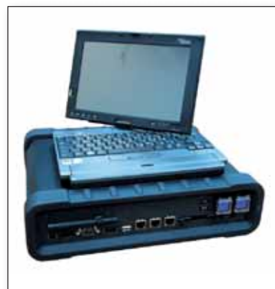
Obr. 4 Přenosný analyzátor Blackbox Wireless Mobile G4500

V nedávné době Elspec představil novou verzi analyzátoru G4000 v přenosné podobě (obr. 4). Tento přístroj nese označení Blackbox Wireless Mobile G4500. Principiálně se jedná o stejný přístroj jako je pevný analyzátor G4000. Přístroj je ale konstruován jako přenosný a na rozdíl od pevného analyzátoru, kde se měření proudu provádí přes interní proudové transformátory, je G4500 vybaven vstupy pro připojení měřicích kleští nebo sond ampflex. Standardně je vybaven pamětí 8 GB a integrovanou kartou Wi-Fi pro snadné připojení k řídicímu počítači. Signál vzorkuje opět s maximální rychlostí 1024 vzorků na periodu.