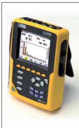
Obr. 2 Přenosný analyzátor Chauvin Arnoux C.A 8335

z nich je napájecí zdroj, dalším je modul pro měření napětí a proudů a třetím je modul počítače určený pro komunikaci a zpracování a ukládání naměřených dat. Dále jsou k dispozici moduly pro bezdrátovou komunikaci nebo modul ovládací a zobrazovací jednotky. Instalace přístroje je velmi jednoduchá. Napětí se měří přes vstupní napěťové svorky. Součástí měřicího modulu jsou i měřicí proudové transformátory s rozsahem 0 – 10 A. Těmito transformátory stačí pouze protáhnout sekundární vodiče měřících proudových transformátorů, kterými bývá vybavena každá rozvodna.