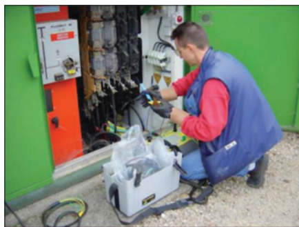
Obr. 3. Triphasor v rázuvzdorné skříni

Ze spolupráce místní (vysílač) a vzdálené ruční jednotky vyplývá další funkce přístroje,