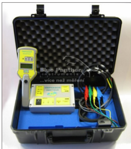
Obr. 1. Měřicí zařízení Triphasor

Ve svém příspěvku autor upozorňuje na možnosti zjištění rovnoměrnosti vyváženosti a zatížení jednotlivých fází nízkonapěťové části distribuční sítě i rozvodů v závodech a možnosti „sfázování“ rozvodů nn od vývodu distribučního transformátoru, až po místo odběru pomocí měřicího zařízení Triphasor (obr. 1) z produkce francouzské firmy Made, s. a. Triphasor je generačním pokračovatelem předchozího zařízení Deltaphase.