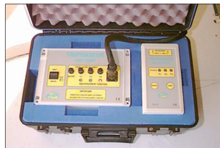
Obr. 4. Přístroj Triphaseur

Přístroj se dodává se sadou proudových kleští a nabíječem pro ruční přijímací jednotku. Naměřené a vypočtené hodnoty jsou přehledně zobrazovány na čtyřřádkovém zobrazovači LCD s automatickým podsvětlením. Přijímač je vybaven třemi indikátory LED, které indikují, na kterou fázi je přijímač právě připojen. Ovládání se děje jedním tlačítkem listováním v menu. Přestože je přístroj původem z Francie, jsou veškeré texty na zobrazovači v českém jazyce. Tato úprava