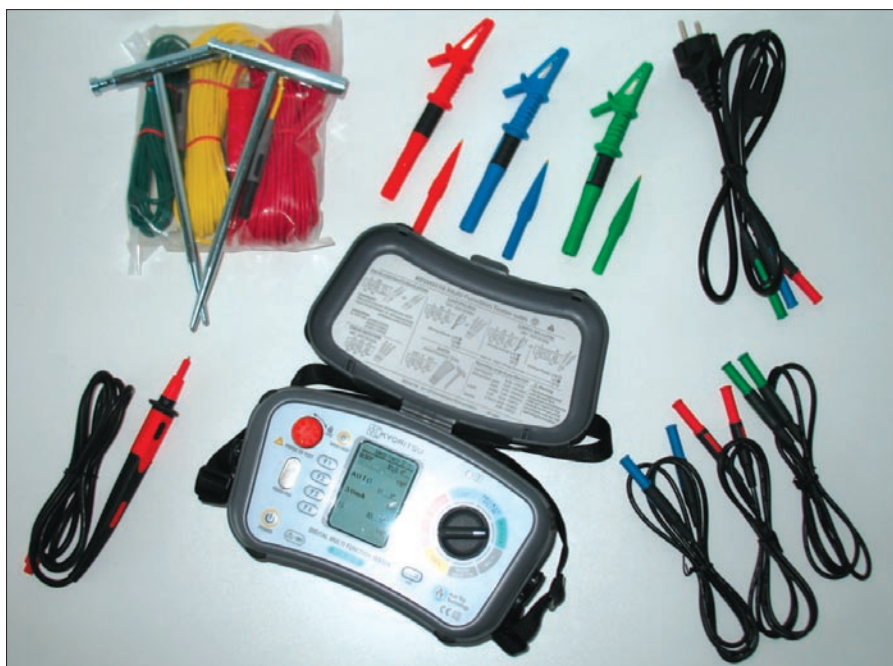
Obr. 2. KEW 6016 a příslušenství