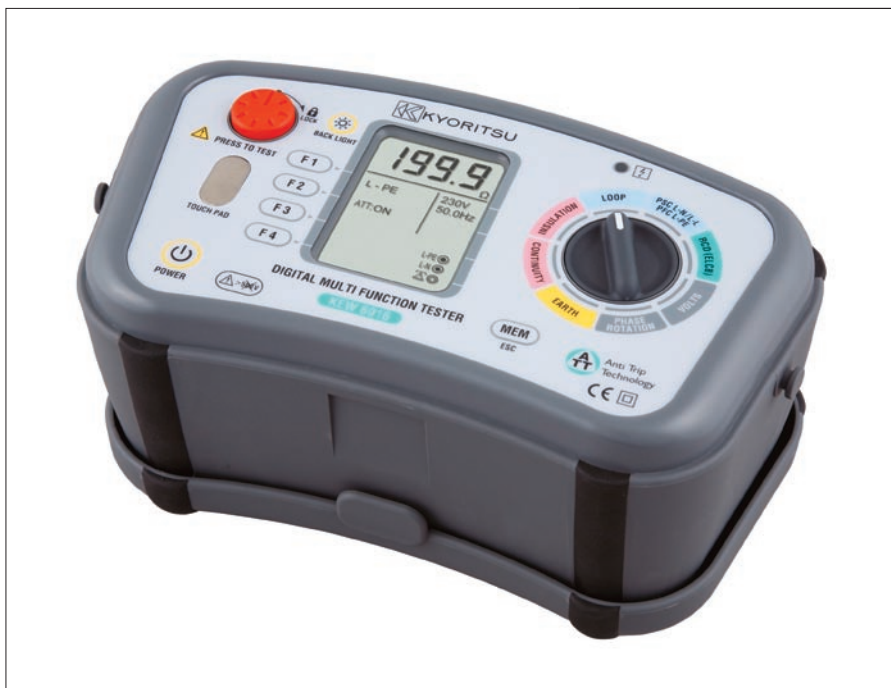
Obr. 1. Nový revizní přístroj KEW 6016

Jak již bylo řečeno, KEW 6016 patří mezi přístroje mnohoúčelové, které v sobě sdružují všechny funkce potřebné pro revizi elektrické instalace podle ČSN 33 2000-6-61. Je schopen provádět kontrolu spojitosti ochranného vodiče, měřit izolační stav napětím 250 V, 500 V a 1 000 V. Další skupinou měření je test spojitosti. Toto měření se provádí proudem 200 mA. Pro měření impedance smyčky je tento přístroj vybaven speciální funkcí, která zamezuje vybavení chráničů během tohoto měření. Měření se provádí na automatických rozsazích 20, 200 a 2000 \Omega testovacím proudem 6 A, 2 A a 15 mA. S měřením impedance smyčky úzce souvisí i měření přepočtených zkratových proudů PSC a PSF. Další skupinou měření je test proudových chráničů. Přístroj je navržen pro test standardních proudových chráničů všech typů s vybavovacím reziduálním proudem 10, 30, 100, 300 a 500 mA. Dále pak obsahuje funkci pro test speciálních proudových chráničů používaných jako ochrana před úrazem elektrickým proudem. Dalším měřením, které je KEW 6016 schopen provádět, je měření zemního odporu, a to třípólovou metodou. Pro tento účel je vybaven pomocnými zemnicemi tyčemi a dlouhými měřicími kabely. Pomocí