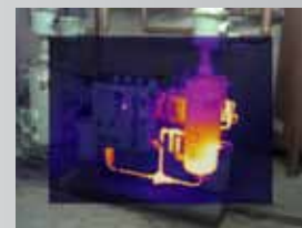
Obraz v obraze