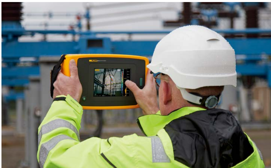
Snímek přesné akustické kamery ii910 detekující částečné výboje ve vysokonapětových systémech.