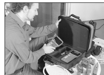
Obr. 4 Brašna s příslušenstvím

jí dvojitý zdroj světla a širokopásmového wattmetru. Plně duplexní FiberTEK FDX představuje vynikající řešení pro optickou certifikaci, úsporu času a zjednodušení dokumentace úplným odstraněním potřeby výměnných modulů. K dispozici jsou tak jedinečné testy pracující v plném duplexu, na dvou vlnových délkách a v obou směrech, které zásadně zjednodušují a zrychlí certifikaci. Navíc je možné měřit délku stiskem jediného tlačítka Autotest. To znamená, že pro každé vlákno je uloženo pět parametrů dané ID kabelu. FiberTEK FDX je dodáván ve třech provedeních: multimódová sada (850/1300 nm) se zdrojem světla LED pro certifikaci 10/100 Mb/s nebo la-