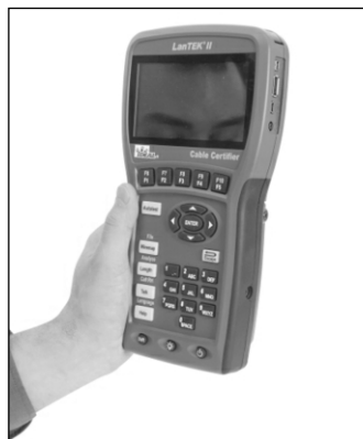
Obr. 1 Certifikační přístroj LanTEK II

Nová řada LanTEK II přináší mnohem rychlejší testovací proces. Pro certifikaci Cat 5e je to devět sekund, pro Cat 6 je třeba 14 sekund a pro Cat 6A pak 16 sekund, a to včetně