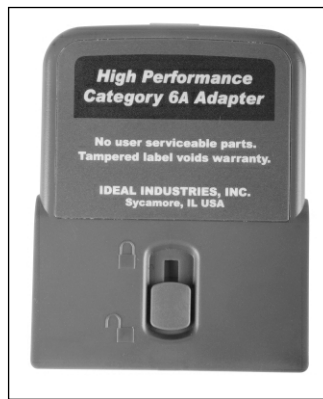
Obr. 2 Testovací adaptér

K přístrojům je dodáván i nový program IDEAL DataCENTER (IDC) pro práci s naměřenými daty a vytváření zpráv. Program kromě jiného nabízí několik typů zpráv, jako jsou detailní certi-