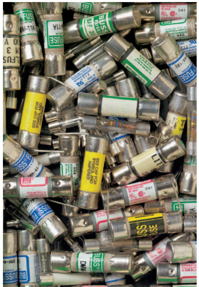
■ Obr. 4

Vaše bezpečnost má vyšší cenu než je cena přístroje nebo pojistky. V tomto případě se nevyplatí šetřit, ochráníte vaše zdraví i nákladnou opravu za zničený přístroj. Další podrobnosti o vhodných pojistkách případně o školeních o měření a přístrojích můžete získat u firmy Blue Panther instruments ( www.blue-panther.cz ).