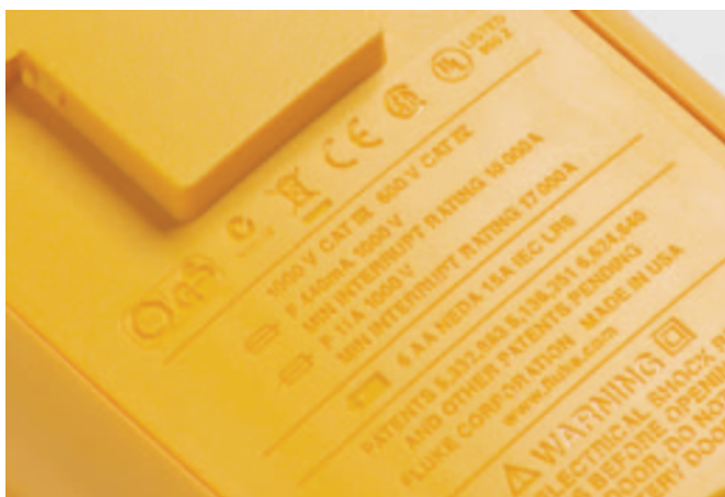
■ Obr. 2

Pracujete-li v prostředí kategorie tři nebo čtyři, měli byste používat přístroje označené CAT III 600 V nebo 1 000 V a nebo CAT IV 600 V. Například při měření na přívozech do budov a venkovních rozvodech by pracovníci energetických podniků či firem pro ně pracujících neměli používat jiné přístroje než kategorie čtyři. Pro snadnou volbu a použití musí výrobci uvádět příslušnou kategorii pro kterou je přístroj použitelný na jeho panelu (obr. 2) tak, aby si byl technik vždy před použitím jist, že používá vhodný přístroj.