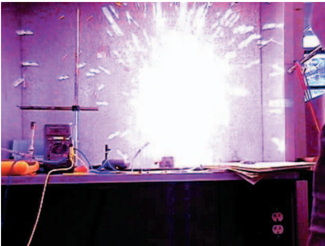
■ Obr. 3

V této situaci zkrat způsobený špatnou pojistkou (nebo drát překlenující pojistkový držák) způsobí to, že jsou měřicí kabely přivedeny na v podstatě neomezený zdroj energie. Kovová část v pojistce (nebo vodiči) se velmi rychle ohřeje, začne se vypařovat a tvoří výbuch. V případě špatné pojistky může uzávěr pojistky silou výbuchu vystřelit. Po otevření pojistky má výbuch neomezené množství kyslíku a vytvoří plazmovou kouli (obr. 3). Měřicí kabely mohou také doutnat a začít velmi rychle hořet. Rozžhavený kov začne stříkat na vaše ruce, paže a obličej. Čím déle působí energie na přístroj, tím více se požár zvětšuje. Vážnost a rozsah popálení nyní záleží jen na tom, jak máte chráněn obličej a jak silné rukavice máte na rukou.