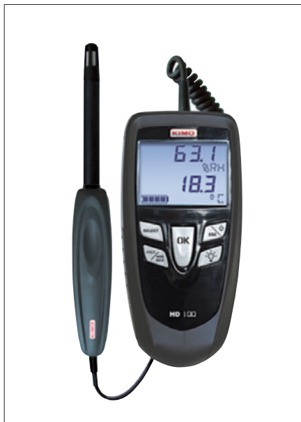
Obr. 1. HD 100 – přístroj pro měření teploty a relativní vlhkosti

Ruční měřící přístroje KIMO se vyrábí ve třech modelových řadách Class 100, Class 200 a Class 300, přičemž v každé řadě jsou zastoupeny modely pro měření teploty, tlaku, relativní vlhkosti, rychlosti proudění vzduchu, otáček, kvality vzduchu, hluku, luxmetry a další.