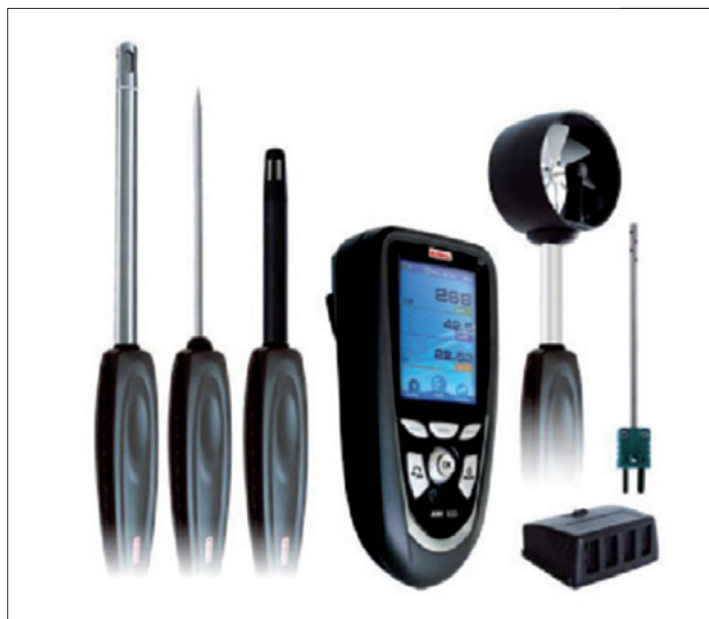
Obr. 3. AMI 300 – univerzální měřicí přístroj