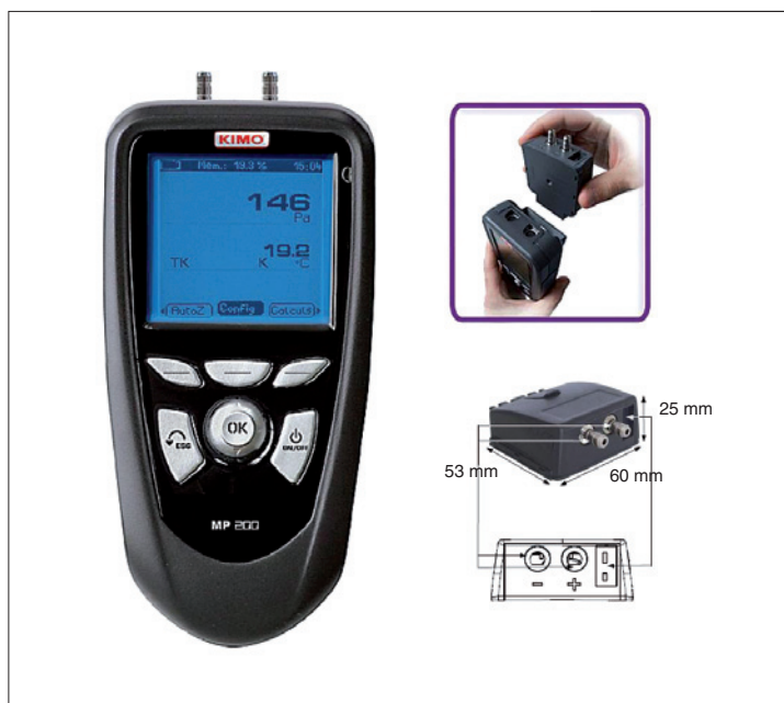
Obr. 2. Přístroje Class 200 využívají výměnné moduly

Modelová řada Class 100 je zastoupena jednoúčelovými měřícími přístroji s jedním nebo se dvěma kanály (např. odporový teploměr nebo teploměr s termočlánkem) a přístroji, kombinujícími některé funkce (teplota + relativní vlhkost, tlak + rychlost proudění apod.), viz obr. 1.