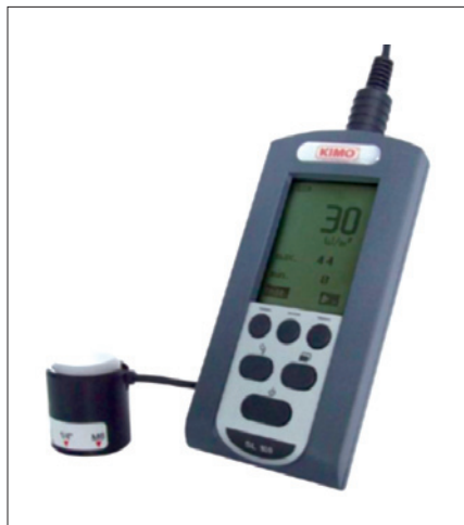
Obr. 6. Solarimetr KIMO SL 100