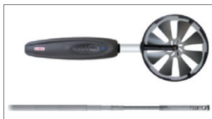
Obr. 5. Sondy pro měření rychlosti proudění vzduchu