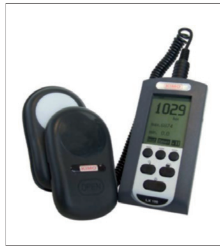
Obr. 7. Luxmetr KIMO LX 100