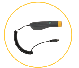
Sonda měření otáček